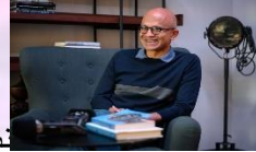
نشأة ساتيا ناديلا

وهذه القيمة المذهلة البالغة مليار دولار أمريكي، تضع ساتيا ناديلا رئيس مايكروسوفت، في نادي النخبة لأصحاب المليارات، الذين حصلوا على أموالهم من التعويضات والرواتب التي يحصلون عليه كموظفين.