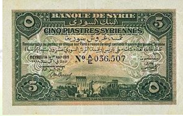
صورة الوجه الأمامي