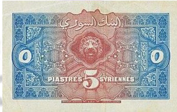
صورة الوجه الخلفي