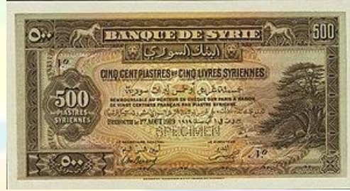
صورة الوجه الأمامي: