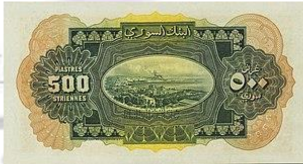
صورة الوجه الخلفي